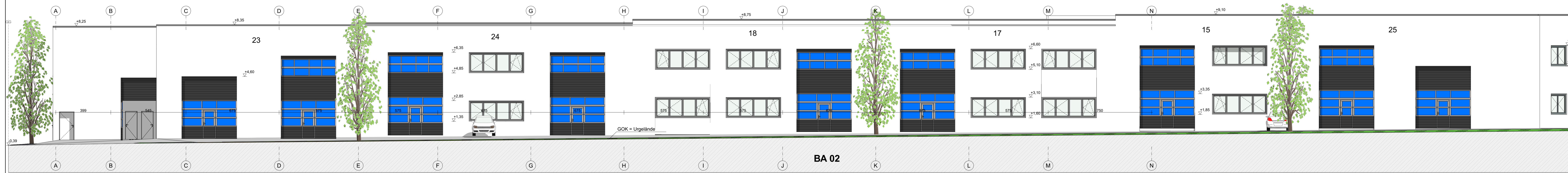
West - Ansicht M = 1:100